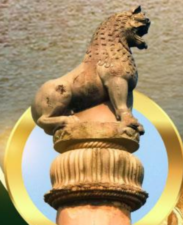
เสาอโศกสิงห์ ณ เวสาลี