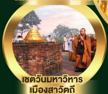
เชตวันมหาวิหาร เมืองสาวัตถี