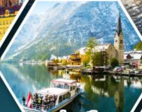
ล่องเรือ ทะเลสาบอัลสตัท