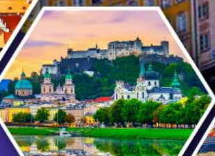
คาร์โลวารี