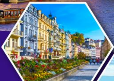
คาร์โลวารี