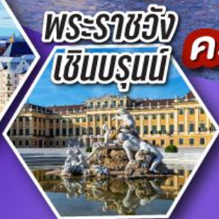
พระราชวัง เซินบรุนน์

เข้าชม ความงดงามและความอลังการ ของพระราชวังเซินบรุนน์