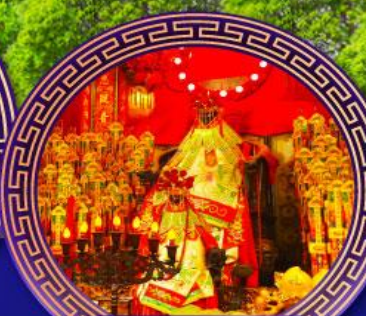
วัดเจ้าแม่กวนอิม ฮ่องกง