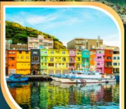
ท่าเรือเจิ้งปิ่น