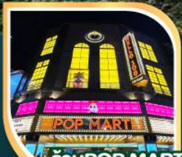
ร้านPOP MART ที่ใหญ่ที่สุดในโลกไต้หวัน