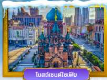
โบสถ์เซนต์โซเฟีย