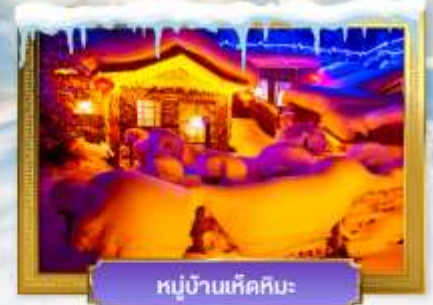
หมู่บ้านเห็ดหิมะ

เดินทางโดย : สายการบินเซินเจิ้นแอร์ไลน์ (ZH)