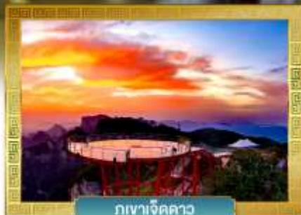
กุเวาเจ็ดดาว