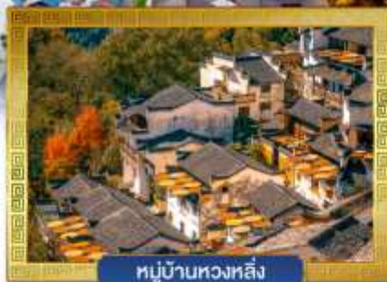
หมู่บ้านหวงหลิ่ง