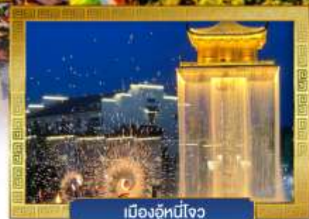
เมืองอุ๋หนี่โจว