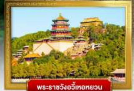
พระราชวังอวิ๋ตหอหยวน