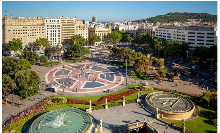
นำท่านเก็บภาพบริเวณด้านหน้า คา

, Timberland , TUMI , Versace , Zwilling , Zegna ฯลฯ ได้เวลาพักผ่อนนำท่านออกเดินทางสู่สนามบิน