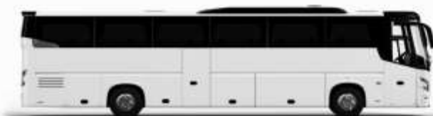
ตัวอย่างรถโดยสาร 1 คัน

หากประเภทห้องที่ท่านริเคอมาเกินจาก เช่น ริเคอห้องพักเป็น TWIN BED หรือ DOUBLE BED ทางบริษัทฯ ขอสงวนสิทธิ์ในการปรับประเภทห้องพัก เป็นตามที่โรงแรมมีอยู่ โดยไม่ต้องแจ้งให้ทราบล่วงหน้า