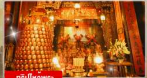
กริปไหวพระ: