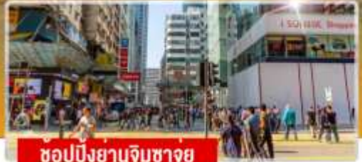
ชอปปีงย่านจิมซาจอย