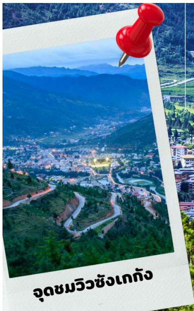
จุดชมวิวซังเกกัง

นำท่านชม จุดชมวิวซังเกกัง (Sangaygang) จุดชมวิวทิวทัศน์ที่สวยงามของหุบเขาเมืองทิมพู เพื่อเก็บภาพประทับใจ จากนั้นนำทุกท่านเดินทางสู่เมืองพาโร ใช้เวลาประมาณ 1 ชั่วโมง