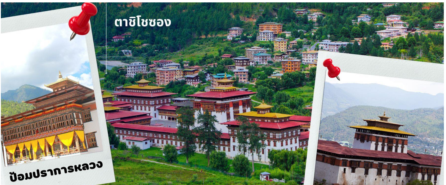
ตาสิโซซอง

นำท่านเดินทางสู่ เมืองทิมพู เมืองหลวงของประเทศภูฏานตั้งแต่ปี ค.ศ. 1961 ใช้เวลาการเดินทางประมาณ 1 ชม. นำท่านเดินทางเข้าชม ตาสิโซซอง มหาปราการแห่งศาสนาและวิหารหลวงแห่งเมืองทิมพู (วันธรรมดาเปิดหลัง 16.30น. / เสาร์-อาทิตย์ เปิดทั้งวัน) ตาสิโซซอง หมายถึง ป้อมแห่งศาสนาอันเป็นมงคล สร้างในสมัยศตวรรษที่ 12 โดย ท่านซัตรุง งาวัง นัมเกล ปัจจุบันเป็นสถานที่ทำงานของพระมหากษัตริย์ สถานที่ทำการของกระทรวงต่างๆ และวัด รวมทั้งเป็นพระราชวังฤดูร้อนของพระสังฆราช และบริเวณอันใกล้ท่านจะได้เห็นวังที่ประทับส่วนพระองค์ของพระราชาธิบดีจิกมีด้วย