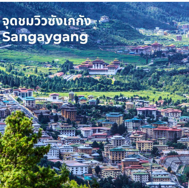
จุดชมวิวซังเกกัง Sangaygang