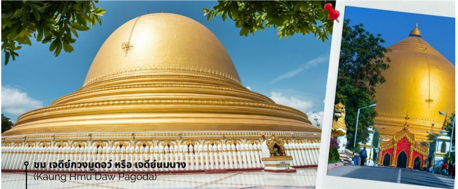
ชม เจดีย์กวางมูดอร์ หรือ เจดีย์นมนาง (Kaung Hmu Daw Pagoda)

นำท่านชม เจดีย์กวางมูดอร์ หรือ เจดีย์นมนาง (Kaung Hmu Daw Pagoda) เป็นเจดีย์พุทธขนาดใหญ่ ตั้งอยู่เขตชานเมืองทางตะวันตกเฉียงเหนือของชะโก๊ง โดยจำลองตามสัณณมาลีมหาเจดีย์ ในประเทศศรีลังกา ฐานชั้นล่างสุดของเจดีย์ประดับด้วยนระและเทวดา 120 องค์ ล้อมรอบด้วยโคมหิน 802 ต้น ซึ่งแกะสลักพร้อมจารึกพุทธประวัติสามภาษาได้แก่ พม่า, มอญ และไทใหญ่ เป็นตัวแทนของสามภูมิภาคหลักสมัยอาณาจักรตองอูยุคฟื้นฟู โดมของเจดีย์ได้รับการทาสีขาวอย่างต่อเนื่อง เพื่อแสดงถึง