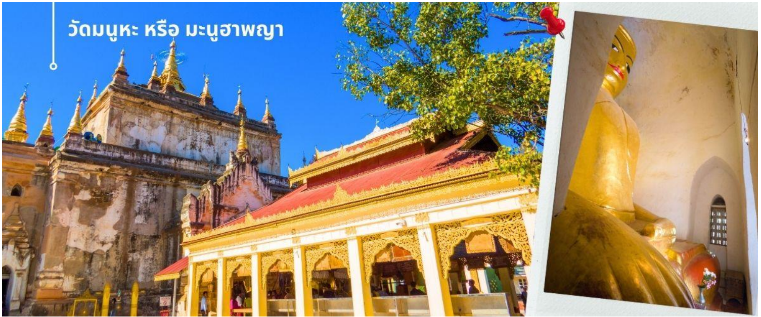
วัดมธุระ หรือ มธุระพญา

ตามประวัติได้เล่าว่าพระเจ้าอโนรธาเมืองขอม กษัตริย์พุกาม ได้ทรงทำสงครามกับอาณาจักรสุธรรมวดี เมืองหลวงของมอญและได้รับชัยชนะ จึงทรงกวาดต้อนกษัตริย์แห่งสุธรรมวดีคือพระเจ้ามธุระมาจองจำในเมืองพุกาม โดยไม่ให้อิสระอะไรมากนัก ต่อมาพระองค์ได้ทรงมีพระบรมราชานุญาตให้พระเจ้ามธุระสร้างวัดเพื่อเป็นสถานที่บำเพ็ญพระราชกุศล ซึ่งคือวัดมธุระแห่งนี้ พระองค์จึงทรงระบายนความคับแค้นพระทัยผ่านการสร้างวัดโดยทรงสร้างให้พระประธานปางขัดสมาธิในวิหารมีขนาดใหญ่จนพระองค์สา (ใหญ่) ของพระพุทธรูปชิดติดกับผนังทั้งสองข้างและมีลักษณะอืดอืด ชาวไทยจึงรู้จักกันในนาม พระอืดอืด นอกจากพระพุทธรูปปางสมาธิแล้วในอีกวิหารหนึ่งยังมีพระพุทธรูปปางไสยาสน์เสด็จดับขันธปรินิพพาน ซึ่งถูกสร้างในลักษณะที่ดูอืดอืดเช่นกัน โดยมีพุทธลักษณะทรงยิ้ม นักโบราณคดีบางกลุ่มตีความว่าพระเจ้ามธุระทรงจะสื่อว่า ความตาย (พระนิพพาน) เท่านั้น จะช่วยให้เราหลุดพ้นได้