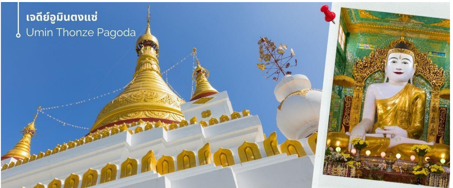
เจดีย์อุมินตงแซ่ Umin Thonze Pagoda

จากนั้นนำท่านชม เจดีย์อุมินตงแซ่ ขอพร พระทันใจ (Umin Thonze Pagoda) ตั้งอยู่ที่ตอยสุริยะอุมินตงแซ่ อยู่ทางเหนือประมาณ 1200 เมตร เป็นวัดผสมผสานที่มีชื่อเสียงที่สุดคือ ทางเดินรูปพระจันทร์เสี้ยว ภายในมีพระพุทธรูป 45 องค์ ทางเดินรูปพระจันทร์เสี้ยวทั้งหลังมีซุ้มประดับประดาสวยงามทั้งหมด 30 ซุ้ม หมายถึง ถ้ำที่พระสงฆ์นั่งสมาธิ ส่วนชื่อวัด อุมิน แปลว่า ถ้ำ ตงแซ่ หมายถึง 30 ด้าน ด้านข้างทางเดินมีพระวิหารสี่เหลี่ยม ภายในประดิษฐานพระพุทธรูปขนาดต่างๆ กว่าสิบองค์ บนเนินเขาด้านหลังทางเดินยังมีกลุ่มพระอุโบสถและเจดีย์ที่มองเห็นทิวทัศน์ที่สวยงามของภูเขาสุริยะและแม่น้ำอิรวดี