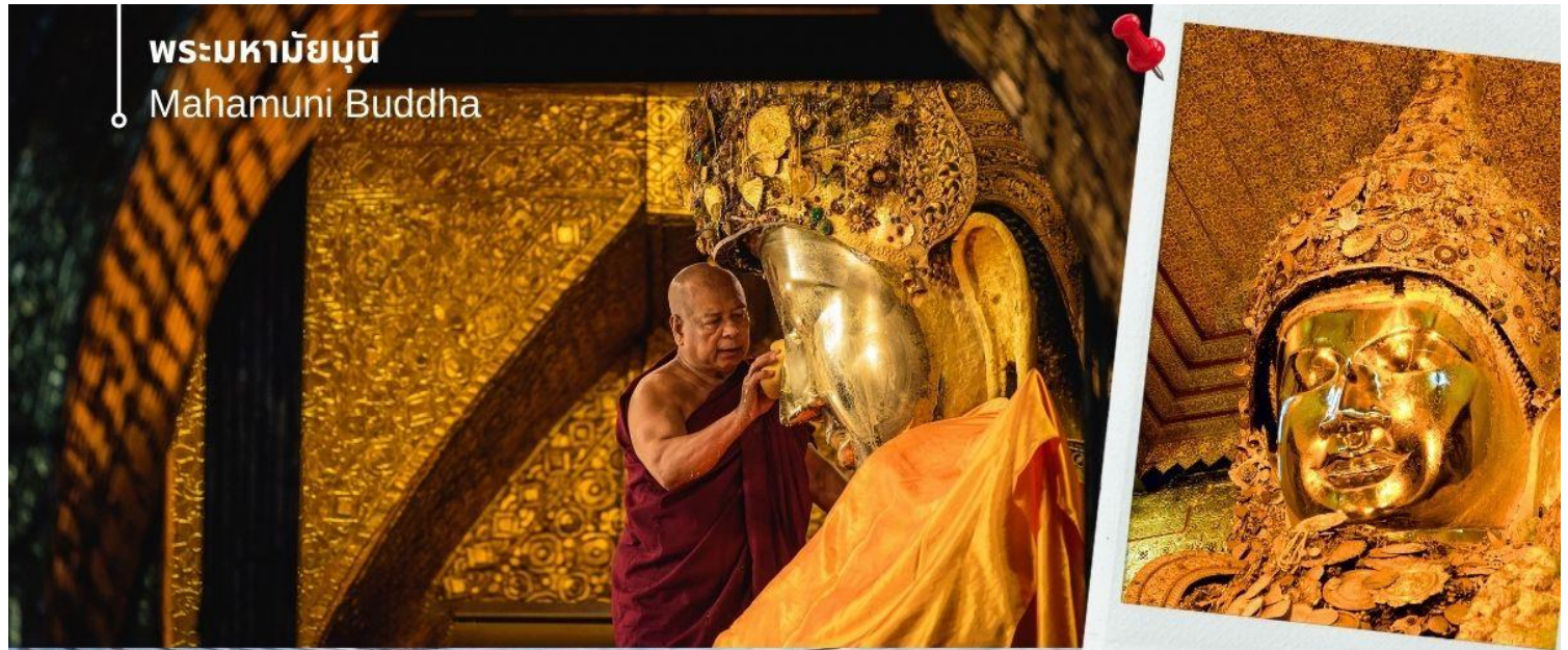
พระมหามายมุนี Mahamuni Buddha

04.00 น. นำท่านนมัสการ และร่วมพิธีอันศักดิ์สิทธิ์ในพิธีล้างหน้าพระพักตร์ พระมหามายมุนี (มหาเมียงมุนี) เป็นหนึ่งใน 5 มหาบูชาสถานศักดิ์สิทธิ์ของพม่า ถือเป็นต้นแบบพระพุทธรูปทองคำขนาดใหญ่ทรงเครื่องกษัตริย์ พระมหามายมุนี หรือ มหาเมียงมุนี เป็นพระพุทธรูปคู่บ้านคู่เมืองของประเทศพม่า คำว่า มายมุนี แปลว่า "ผู้รู้อันประเสริฐ" ด้วยความเชื่อว่าพระพุทธรูปพระมหามายมุนี เป็นพระพุทธรูปที่มีชีวิต ด้วยเหตุที่ได้รับประทานพร หรือบางตำนานก็กล่าวไว้ว่าได้รับประทานลมหายใจจากพระพุทธเจ้า จึงมีประเพณีล้างพระพักตร์ถวายโดยทุกเช้าในเวลาประมาณ 04.00 น. พระมหาเถระและสาธุชนทั่วไปที่ศรัทธาจะมาทำพิธีล้างพระพักตร์ด้วยน้ำอบน้ำหอมผสมทานาคาอย่างดี พร้อมกับใช้แปรงทองแปรงที่พระโอษฐ์เสมือนหนึ่งแปรงพระทนต์ถวายพระพุทธเจ้า ก่อนใช้ผ้าจากศรัทธาสาธุชนที่ถวายมาเช็ดจนแห้งสนิท แล้วนำกลับคืนแก่สาธุชนผู้นั้นไปบูชาต่อ พร้อมใช้พัดทอง