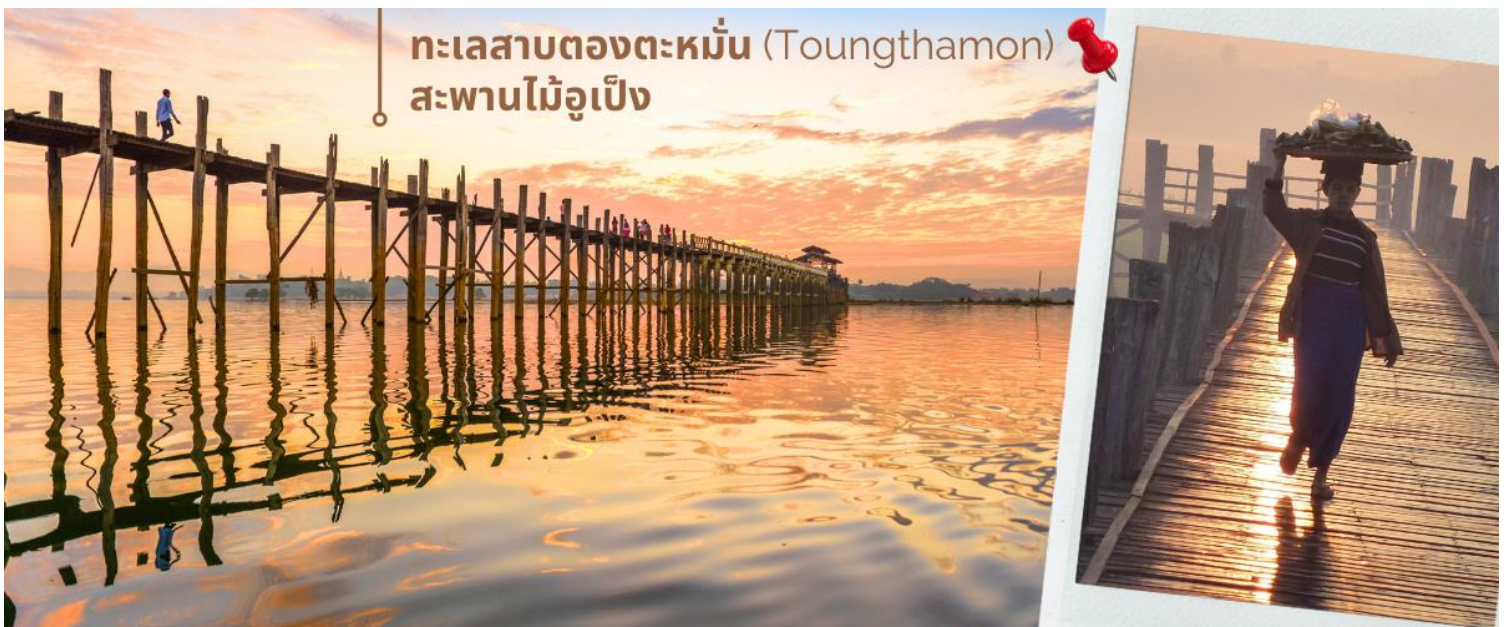
ทะเลสาบตองตะหมัน (Toungthamon) สะพานไม้อุเป็ง

นำท่านสู่ ทะเลสาบตองตะหมัน (Toungthamon) ทะเลสาบที่เป็นที่ตั้งของสะพานไม้สักที่ยาวที่สุดในโลก และยังคงมีการใช้งานจนถึงปัจจุบัน ระดับน้ำในทะเลสาบจะมีน้ำขึ้นเยอะหรือน้อยขึ้นอยู่กับฤดูกาล ช่วงฤดูหนาว น้ำจะแห้งกลายเป็นแผ่นดินอันอุดมสมบูรณ์ เหมาะสำหรับการเพาะปลูก เหนือท้องน้ำมีสะพานไม้ ทอดข้ามทะเลสาบ 1.2 กิโลเมตร เรียกว่า สะพานไม้อุเป็ง