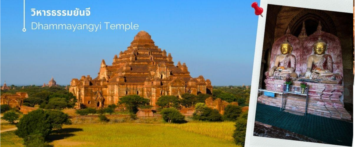
วิหารธรรมยัญจี Dhammayangyi Temple

จากนั้นชม วิหารธรรมยัญจี (Dhammayangyi Temple) เป็นวัดในเมืองพุกาม ประเทศพม่า เป็นวัดขนาดใหญ่ที่สุดในพุกามสร้างในรัชกาลพระเจ้านระระตุ กษัตริย์แห่งราชวงศ์พุกาม ได้ชื่อว่าเป็นผู้โหดร้ายและเป็นจุดเริ่มต้นความเสื่อมของอาณาจักรพุกาม มีพระนามที่เป็นที่รู้จักอีกพระนามหนึ่งว่า "อิมตอวสยัน" ที่ได้ชื่อว่าเป็นกษัตริย์จอมโหด เนื่องจากทรงลอบปลงพระชนม์พระบิดาคือ พระเจ้าอะลองสิธู และพระเจ้ามินชินสอ พระเชษฐา เพื่อขึ้นครองราชย์ จึงเชื่อกันว่าทรงสร้างวัดอันใหญ่โตนี้เพื่อไถ่บาปของพระองค์เอง