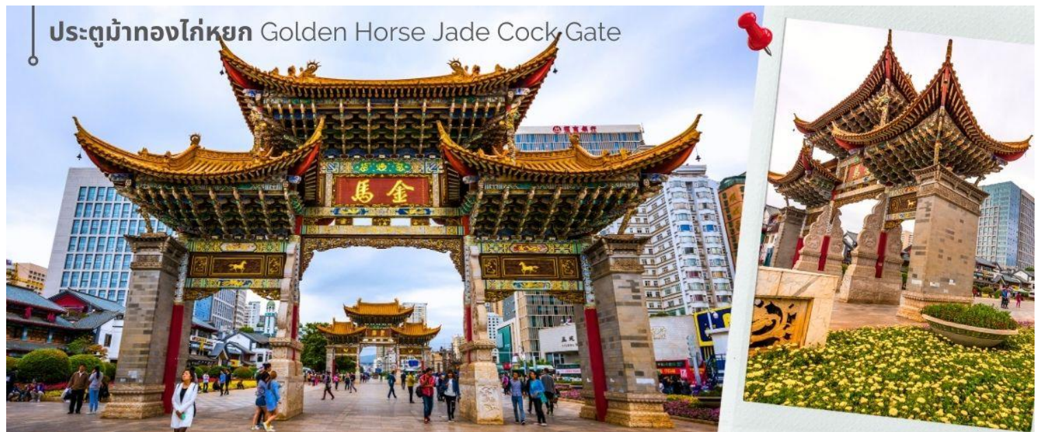
ประตูม้าทองไก่หยก Golden Horse Jade Cock Gate

ชม ซุ้มประตูม้าทอง และ ซุ้มประตูไก่หยก ซึ่งภาษาจีนเรียกว่าจินหม่า และปี้จี้ จึงเอาคำย่อ จินปี้ มาชานานนามถนนแห่งนี้ ซุ้มม้าทองและไก่หยก มีอายุร่วม 400 ปี สร้างขึ้นในสมัยราชวงศ์หมิง ในถนนย่านการค้าแห่งนี้ เป็นแหล่งเสื้อผ้าแบรนด์เนมทั้งของจีนและต่างประเทศ รวมทั้งเครื่องประดับ อัญมณี ร้านเครื่องดื่ม และร้านขายของที่ระลึกมากมาย