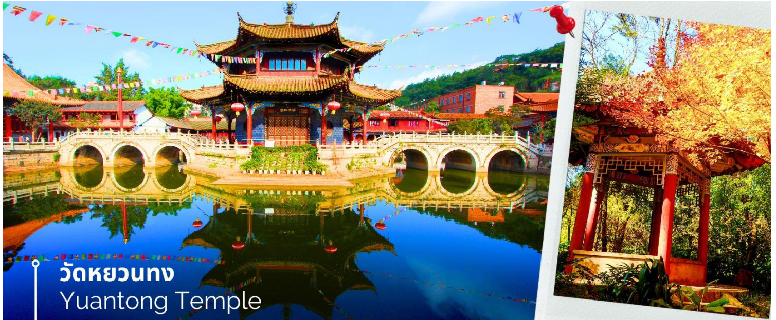
วัดหยวนทอง Yuantong Temple

นำท่านชม วัดหยวนทอง (Yuantong Temple) วัดแห่งนี้เป็นวัดที่ใหญ่และเก่าแก่ที่สุดในเมืองคุนหมิง สร้างมาตั้งแต่สมัยราชวงศ์ถัง มีอายุยาวนานประมาณ 1,200 กว่าปี การสร้างวัดแห่งนี้จะแปลกตากว่าวัดอื่นในจีน เพราะปกติแล้วการสร้างวัดของจีนส่วนมากจะต้องสร้างอยู่บนภูเขา แต่วัดหยวนทองสร้างวัดต่ำกว่าภูเขา โดยวิหารจะอยู่ต่ำที่สุด เนื่องจากวัดแห่งนี้ไม่ได้สร้างขึ้นเพื่อเป็นวัดโดยตรง แต่เคยเป็นศาลเจ้าแม่กวนอิมมาก่อน