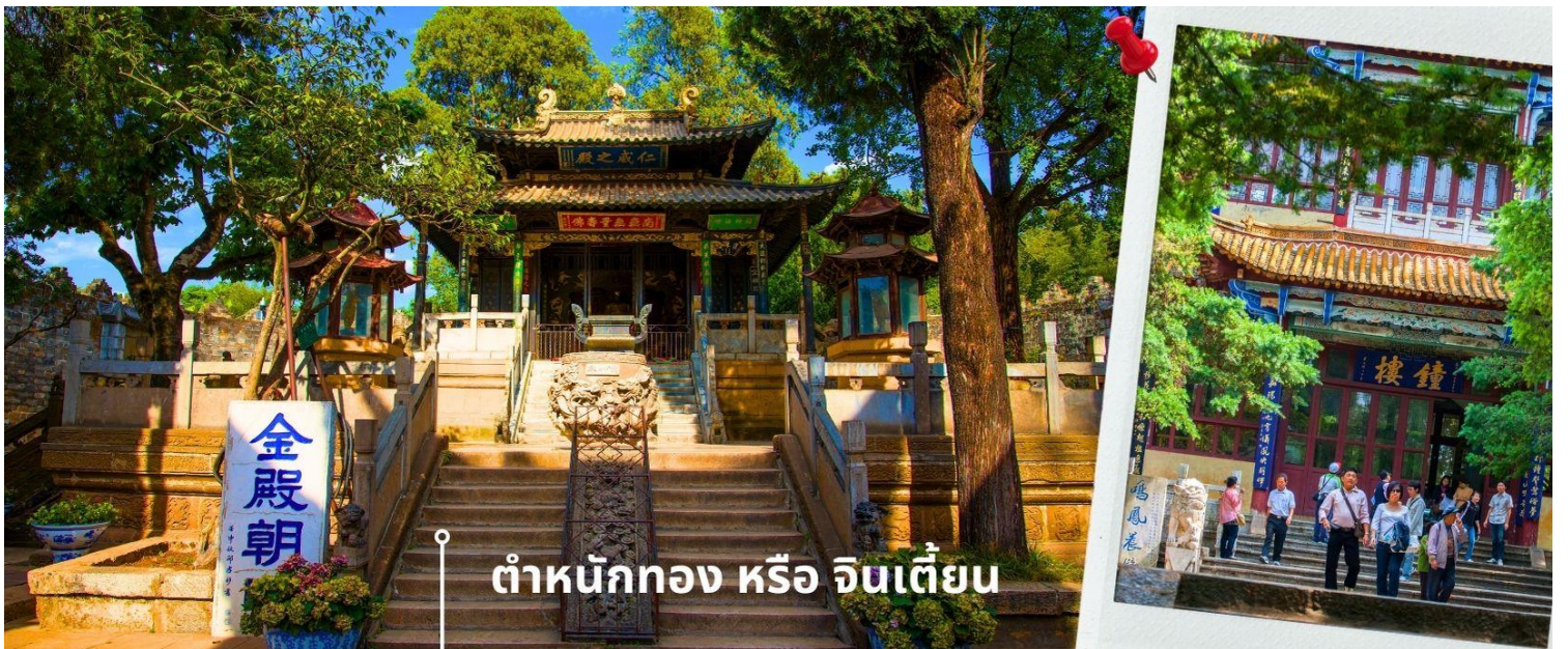
ตำหนักทอง หรือ จินเตี้ยน

เช้า รับประทานอาหารเช้า ณ ห้องอาหารโรงแรม (1) นำท่านเยี่ยมชม ตำหนักทอง หรือ จินเตี้ยน (The Golden Temple Park | Jindian park) ( ไม่รวมค่ารถแบตเตอร์รี่ 10 หยวน/ท่าน ) โบราณสถานสำคัญของมณฑลยูนนาน ที่ได้รับการปกป้องดูแลโดยรัฐบาลจีน ตั้งอยู่บริเวณเชิงเขาหมิงเฟิง ล้อมรอบด้วยแนวกำแพงและหอคอยเหมือนเป็นป้อมปราการ ตำหนักทองถูกเรียกตามลักษณะอาคารที่มีสีทองอร่าม จากทองเหลืองในส่วนของผนังและหลังคา รวมกว่า 200 ตัน โดยถือเป็นสิ่งปลูกสร้างสัมฤทธิ์ที่ใหญ่ที่สุดของจีน ภายในมีรูปปั้นทองโดยมีเงินอยู่ (เสวียนอยู่) เทพเจ้าลัทธิเต๋าเป็นองค์ประธาน