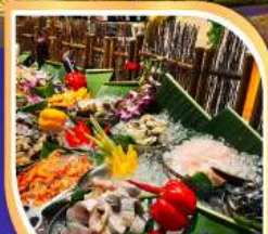
บุฟเฟ่ต์ รวมเครื่องดื่ม แอลกอฮอล์แบบไม่อั้น