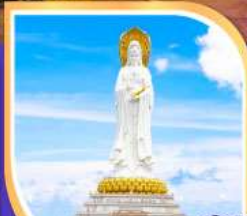
สวน พุทธธรรมหนานซาน เจ้าแม่กวนอิม