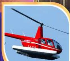
360 องศาด้วย เฮลิคอปเตอร์