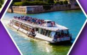
ล่องเรือบาโตมุซ ชมกรุงปารีส

เที่ยวเมืองวาอุซ เมืองหลวงของสาธารณรัฐ ลิกเทินสไตน์