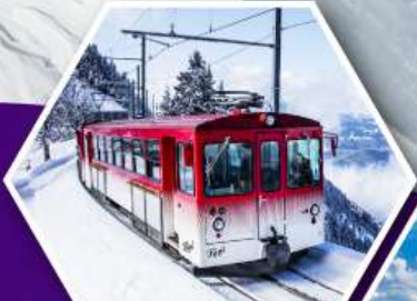
นั่งรถไฟใต้เขาริก