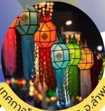
เทศกาลโคมแสนดวง จ.ลำพูน