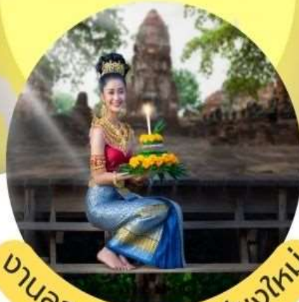
งานลอยกระทง จ.เชียงใหม่