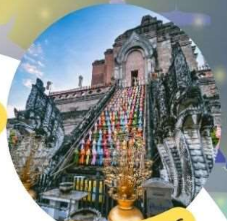
ไหว้พระขอพร