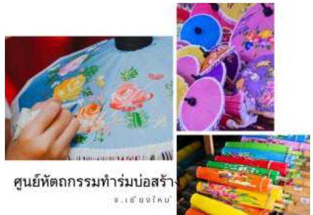
ศูนย์หัตถกรรมทำร่มบ่อสร้าง จ.เชียงใหม่