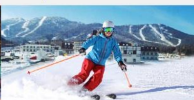
ลานสกียาปู๋ลี่