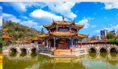
วัดหยวนทง