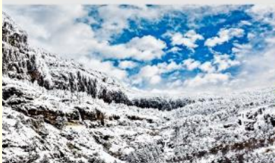
ภูเขาหิมะเจียวจื่อ