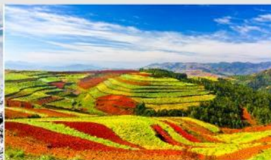
แผ่นดินสีแดง