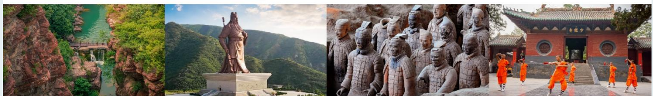
อุทยานสวรรค์หยุนโถซาน บ้านเกิดท่านกวนอู สุสานทหารจีนซี ชมโชว์กังฟูเล่าหลิน