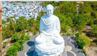
วัดลองเซิน