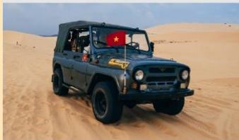
ทะเลทรายขาว