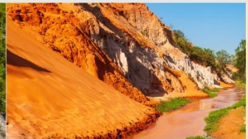
ล้ำธารนางฟ้า

*ทางบริษัทฯ ขอสงวนสิทธิ์ในการสลับโปรแกรมทัวร์ตามความเหมาะสมขึ้นอยู่กับสถานการณ์หน้างาน โดยคำนึงถึงผลประโยชน์ของลูกค้าเป็นสำคัญ