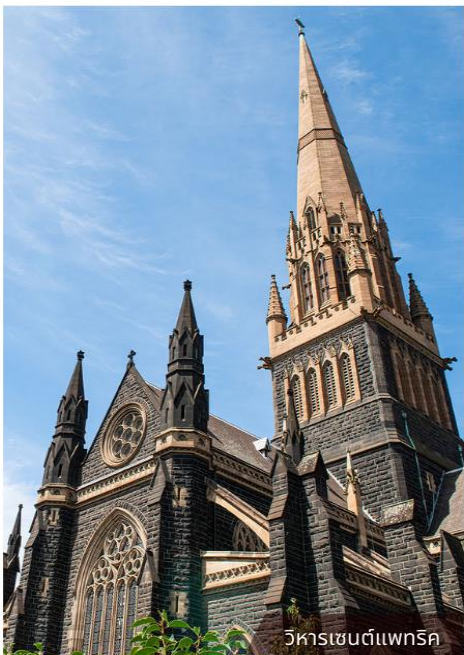
วิหารเซนต์แพทริก