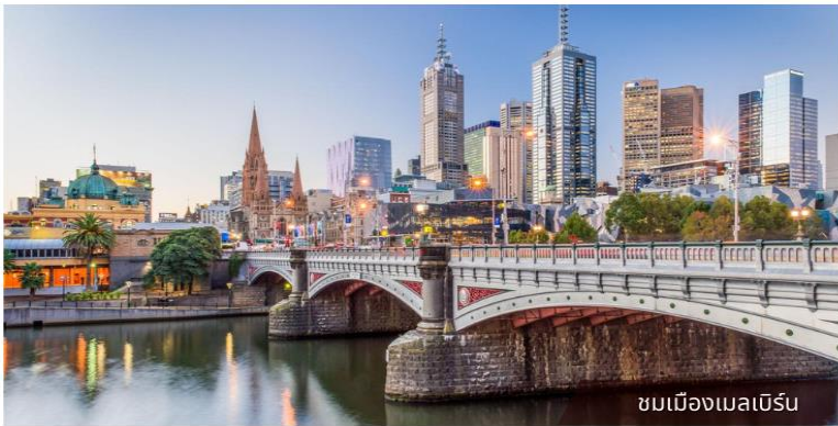
ชมเมืองเมลเบิร์น