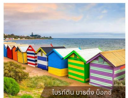
ไบรด์ตัน บาร์ติง บ็อกซ์