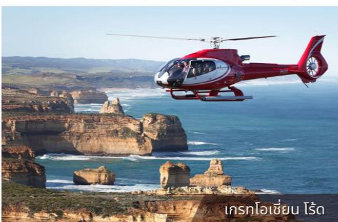
เกรทโอเชียน ไรด์