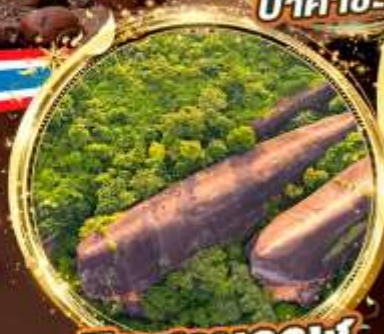
หินสามวาฬ