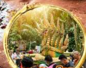
ป่าคำชะโนด