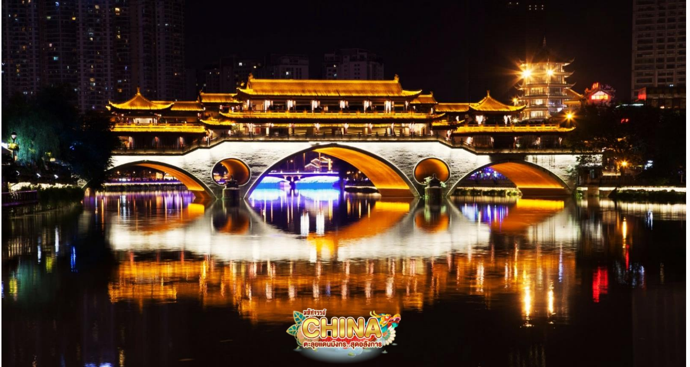
เรียบริ้อยแล้ว

แค่สะพานธรรมดาๆ ภายในยังเป็นที่ตั้งของภัตตาคารยอดที่นิยมของเมืองเฉิงตู ซึ่งตั้งอยู่ในแหล่งท่องเที่ยวอันคึกคัก ยามค่ำคืนจะเปิดไฟประดับประดาสะท้อนผืนน้ำสวยงาม ใครได้มาเที่ยวก็มักจะมารวมตัวกันที่สะพานโบราณเพื่อถ่ายรูป และเชื่อกันว่ามาถึงเมืองเฉิงตู