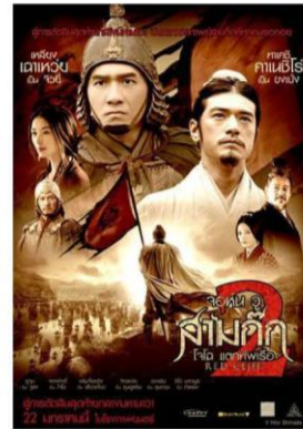
ภาพยนตร์และซีรีส์ชื่อดัง ถ่ายทำที่ Hengdian World Studios