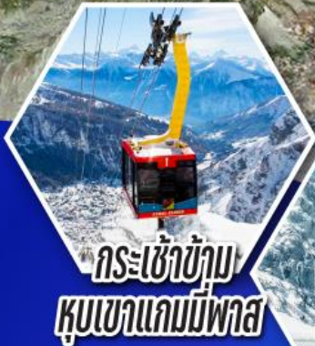
กระเช้าข้าม หุบเขาแกมมีพาส