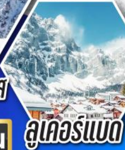
ลูคอร์นแบด