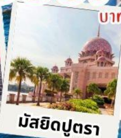
มัสยิดปุตรา