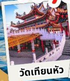
วัดเทียนหัว