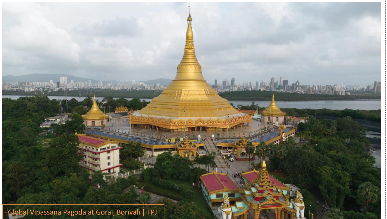
Global Vipassana Pagoda at Gorai, Borivali

เช้า รับประทานอาหารเช้า ณ ห้องอาหารของโรงแรม (มื้อที่ 2) จากนั้นเช็คเอาท์สัมภาระ