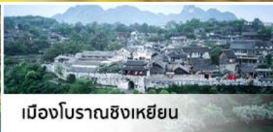
เมืองโบราณซิงเหยียน