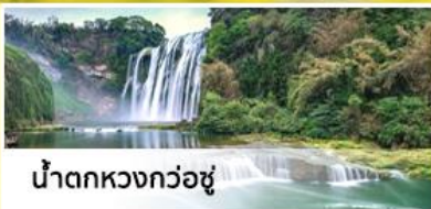
น้ำตกหวงกวอซู