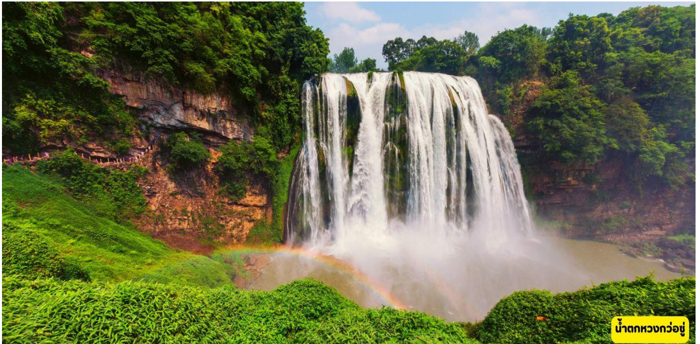
น้ำตกหวงกั๋วชู่

วันที่สาม ฉวีจิ่ง - นั่งรถไฟสู่อันซุ่น - G1392:09.34 – 11.07 น้ำตกหวงกั๋วชู่ (บันไดเลื่อนขึ้น - ลง)