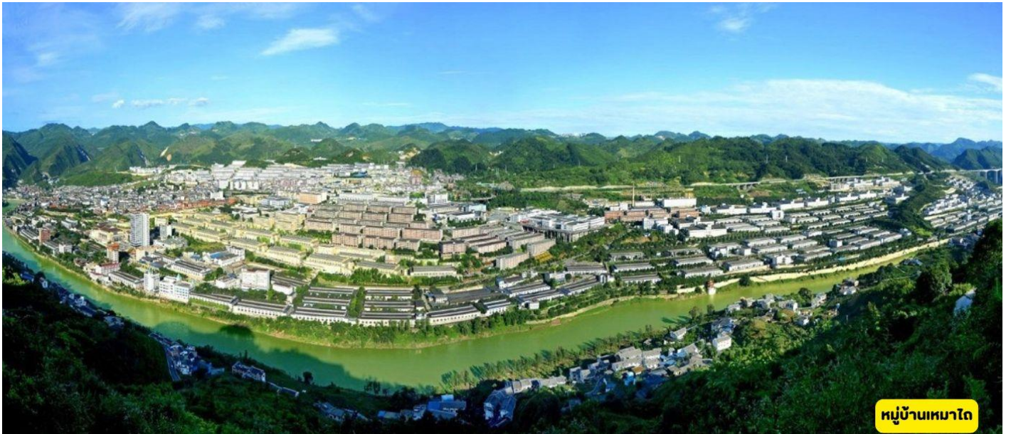
หมู่บ้านเหมาไถ