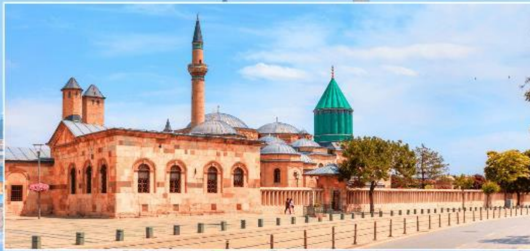
พิพิธภัณฑ์เมฟลานา

เย็น รับประทานอาหารเย็น ที่พัก ➡️ โรงแรมมาตรฐานตุรเคีย 4-5ดาว หรือเทียบเท่า