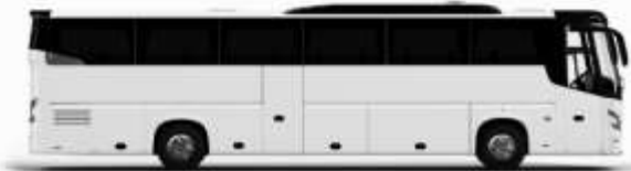
ตัวอย่างรถโดยสาร 1 คัน

ค่าที่พักตามที่ระบุในรายการหรือเทียบเท่าระดับเดียวกัน (พักห้องละ 2 ท่าน) หากประเภทห้องที่ท่านริเคอสมหาเกินออก เช่น ริเคอสห้องพักเป็น TWIN BED หรือ DOUBLE BED ทางบริษัทของสงวนสิทธิ์ในการปรับประเภทห้องพัก เป็นตามที่โรงแรมมีอยู่ โดยไม่ต้องแจ้งให้ทราบล่วงหน้า