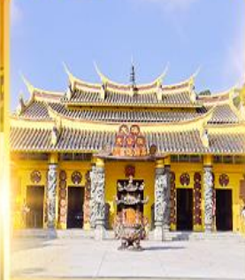
วัดชอพรเทพเจ้า