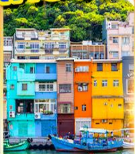
หมู่บ้านประมงเจินปิง