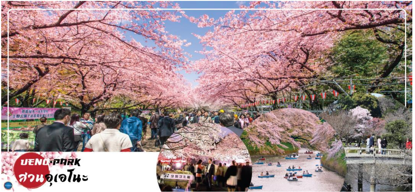
UENO PARK สวนอุเอโนะ