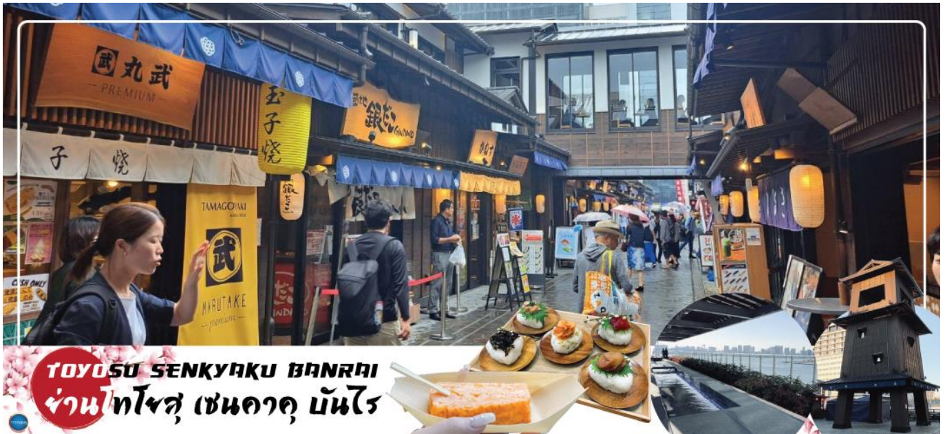
TOYOSU SENKYAKU BANRAI ย่านโทโยสุ เซนคาคุ บันไร

จากนั้นนำท่านสู่ ย่านโทโยสุ เซนคาคุ บันไร (Toyosu Senkyaku Banrai) (ใช้เวลาเดินทางประมาณ 25 นาที) เป็นสถานที่ท่องเที่ยวใหม่ที่ตั้งอยู่ในย่าน Toyosu ของ Tokyo ที่เป็นเหมือนตลาดในธีมย้อนยุคสมัยเอโดะ เปิดให้บริการในวันที่ 1 กุมภาพันธ์ 2024 โดยมีทั้งตลาด อาหาร และสถานบันเทิง นอกจากนี้ยังมีออนเซ็น 24 ชั่วโมงที่ช่วยให้เราผ่อนคลายอีกด้วย เป็นตลาดที่มีทั้งอาหารทะเลสดใหม่จาก Toyosu Market และอาหารญี่ปุ่นหลากหลายชนิด เช่น ซูชิ เทมปุระ และราเมน ที่นี้มีร้านค้าจำนวนมากที่ขายของที่ระลึกและวัตถุดิบตามฤดูกาล นอกจากนี้ยังมีจุดออนเซ็นแช่เท้า (ฟรี) ที่ยังชมบรรยากาศของโตเกียวได้อีกด้วย