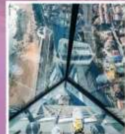
QINGDAO HAITIAN CENTER