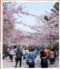
ซากุระจงซา