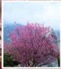
ชมดอกท้อภูเขาไถ่ซา