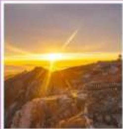
ยอดเขาอวิ้อว