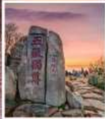
หินแกะสลักในสมัย ราชวงศ์ถัง