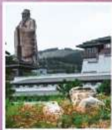
รูปปั้นงจื้อ ที่ใหญ่ที่สุดในโลก