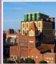
โรงงานเบียร์ซิงเต่า