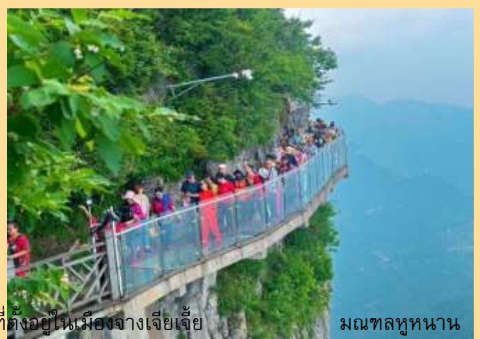
ที่ตั้งอยู่ในเมืองจางเจียเจีย