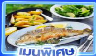
เมนูพิเศษ ปลากราดย่าง

อัลสส์ตีทท์ เวียนนา อินส์บรุค ปราสาทนอยชวาสไตน์ ลูเซิร์น ริก