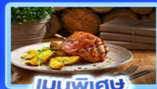
เมนูพิเศษ ขาหมูเยอรมัน