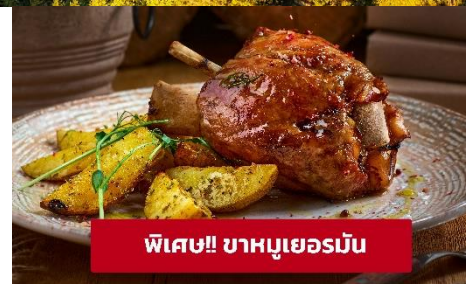
พิเศษ! ขาหมูเยอรมัน

เย็น 🍷 รับประทานอาหารเช้า เย็น (มื้อที่6)