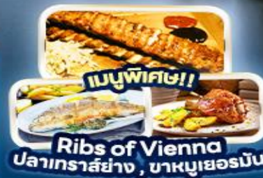
เมนูพิเศษ!! Ribs of Vienna ปลาเกราส์ย่าง, ฆาญเยอร์มิน