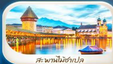
สะพานไม้ชาเปล