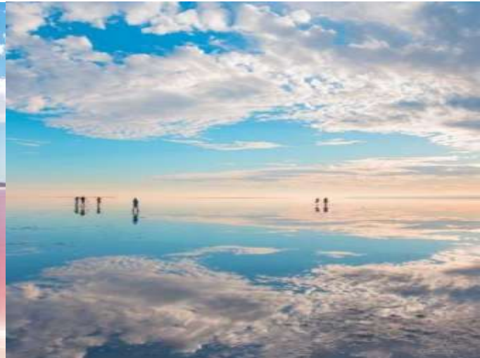
หนัง Star War อีกด้วย

จากนั้นเดินทางสู่ เมืองซาฟแรนโบลู (Safranbolu)