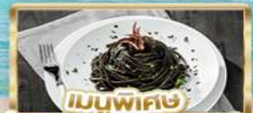
เมนูพิเศษ