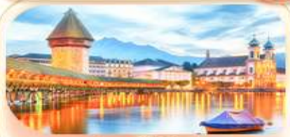
สะพานไมซ์าปค