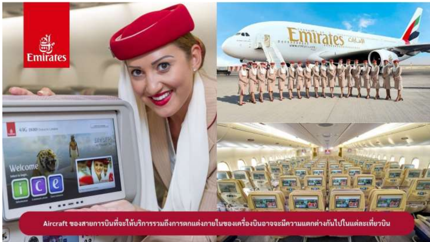
Aircraft ของสายการบินที่จะให้บริการรวมถึงการตกแต่งภายในของเครื่องบินอาจมีความแตกต่างกันไปในแต่ละเที่ยวบิน