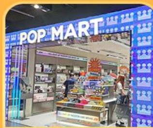
ช้อปปิ้ง POP MART