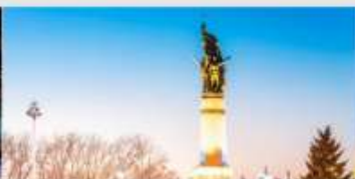
อนุสาวรีย์ผึ้งหง