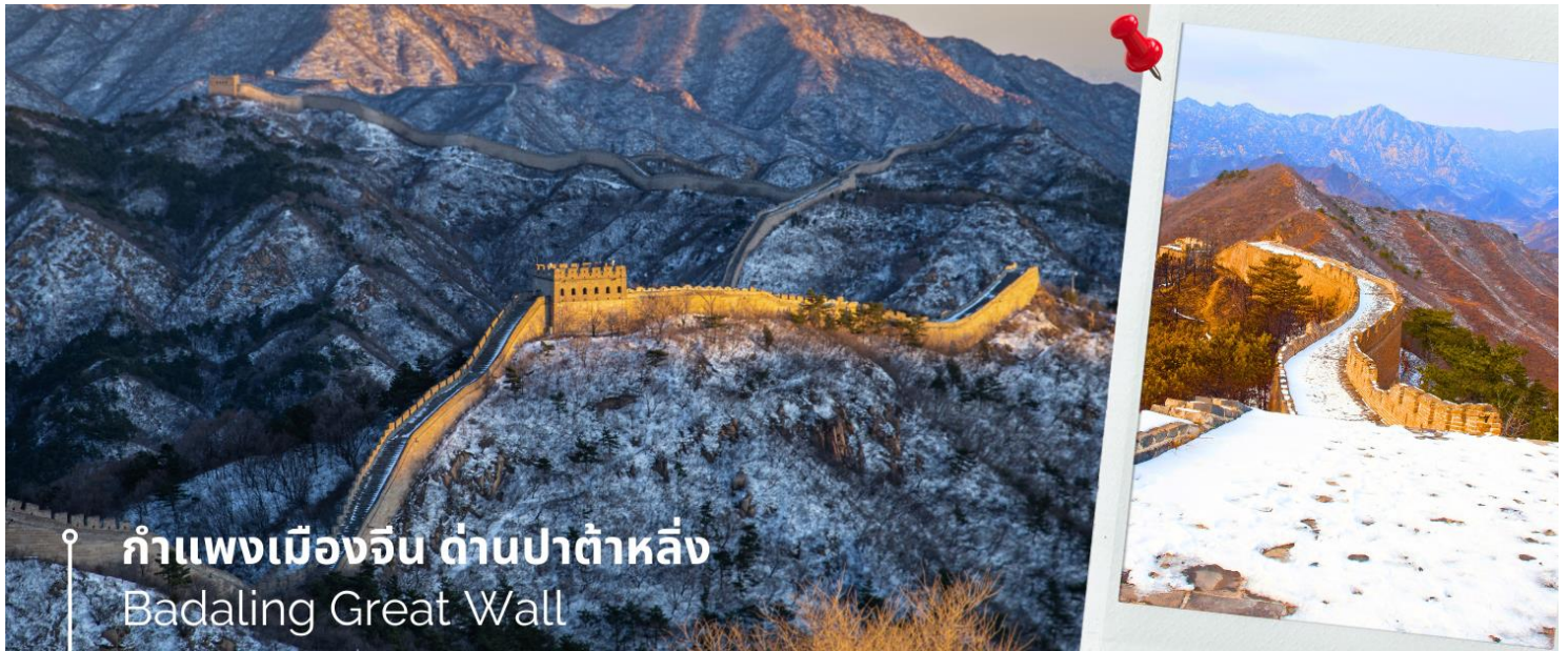
กำแพงเมืองจีน ด้านปาต้าหลิ่ง Badaling Great Wall

จากนั้นนำท่านเดินทางชมความยิ่งใหญ่ของ กำแพงเมืองจีน ด้านปาต้าหลิ่ง เป็นที่ตั้งของกำแพงเมืองจีนที่มีผู้เข้าชมมากที่สุด ห่างจากใจกลางเมืองปักกิ่งไปทางตะวันตกเฉียงเหนือประมาณ 80 กิโลเมตร ในเมืองปาต้าหลิ่ง เขตหยานชิ่ง เทศบาลนครปักกิ่ง ได้รับการอนุรักษ์อย่างดีที่สุดของกำแพงเมืองจีน นำท่านนั่งกระเช้าลอยฟ้า (รวมค่ากระเช้า) เพื่อขึ้นไปยังจุดชมวิวของด้านปาต้าหลิ่ง ด้วยความสะดวกสบาย ให้ท่านได้มีเวลาถ่ายรูปเก็บบรรยากาศ ความสวยงามและ