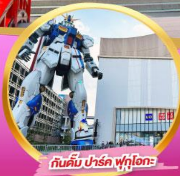
กันดั้ม ปาร์ค ฟุกุโอกะ

สัมผัสความโรแมนติก ชมซากุระในคิวชู พักออนเซ็น 1 คืนพร้อมอาหารค่ำ อิสระท่องเที่ยว 1 วันเต็มในฟุกุโอกะ