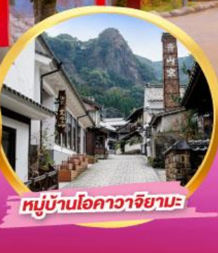
หมู่บ้านโอคาวาจิยามะ