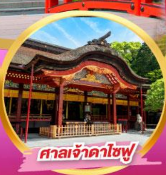
ศาลเจ้าคาโซฟู