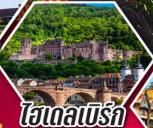
ไฮเดลเบิร์ก