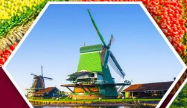
หมู่บ้านกังหันลม ซานส์สกินส์