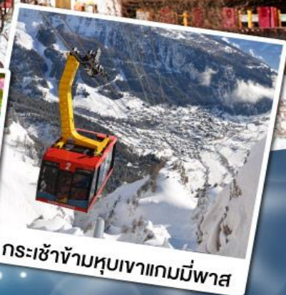
กระเช้าข้ามหุบเขาแกมมีพาส

18-24 ก.พ. 68 11-17 มี.ค. 68 29 เม.ย.-05 พ.ค. 68