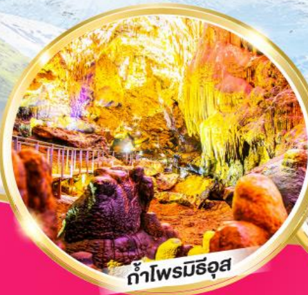
ถ้ำไฟรมิธอส