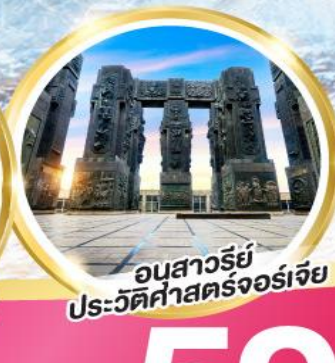
อนสาวรีย์ ประวัติศาสตร์จอร์เจีย