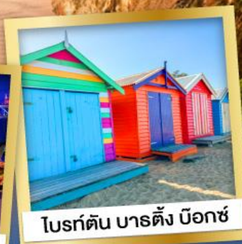
ไบรด์ตัน บาร์ตัง บ็อกซ์