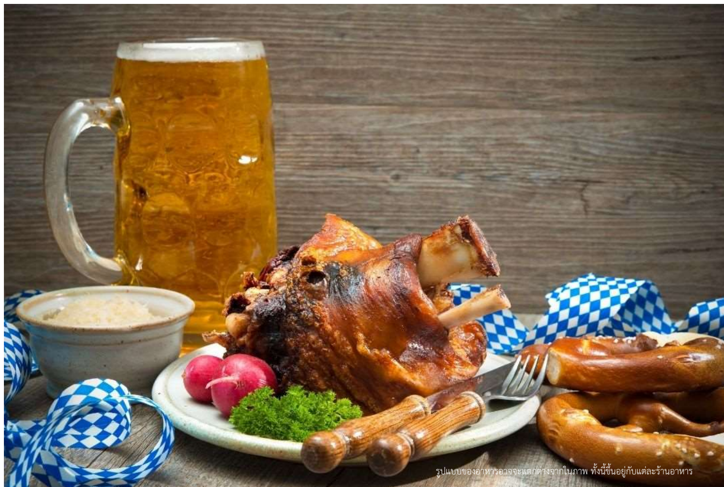
รูปแบบของอาหารอาจจะแตกต่างจากในภาพ ทั้งนี้ขึ้นอยู่กับแต่ละร้านอาหาร

วันที่สาม ฮัลล์สตัดท์-เมืองเซสกีครุมลอฟ-ปราสาทครุมลอฟ